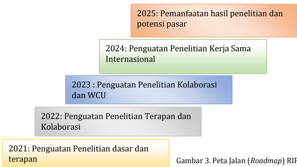
Gambar 3. Peta Jalan (Roadmap) RIP FISIP USU 2021- 2025